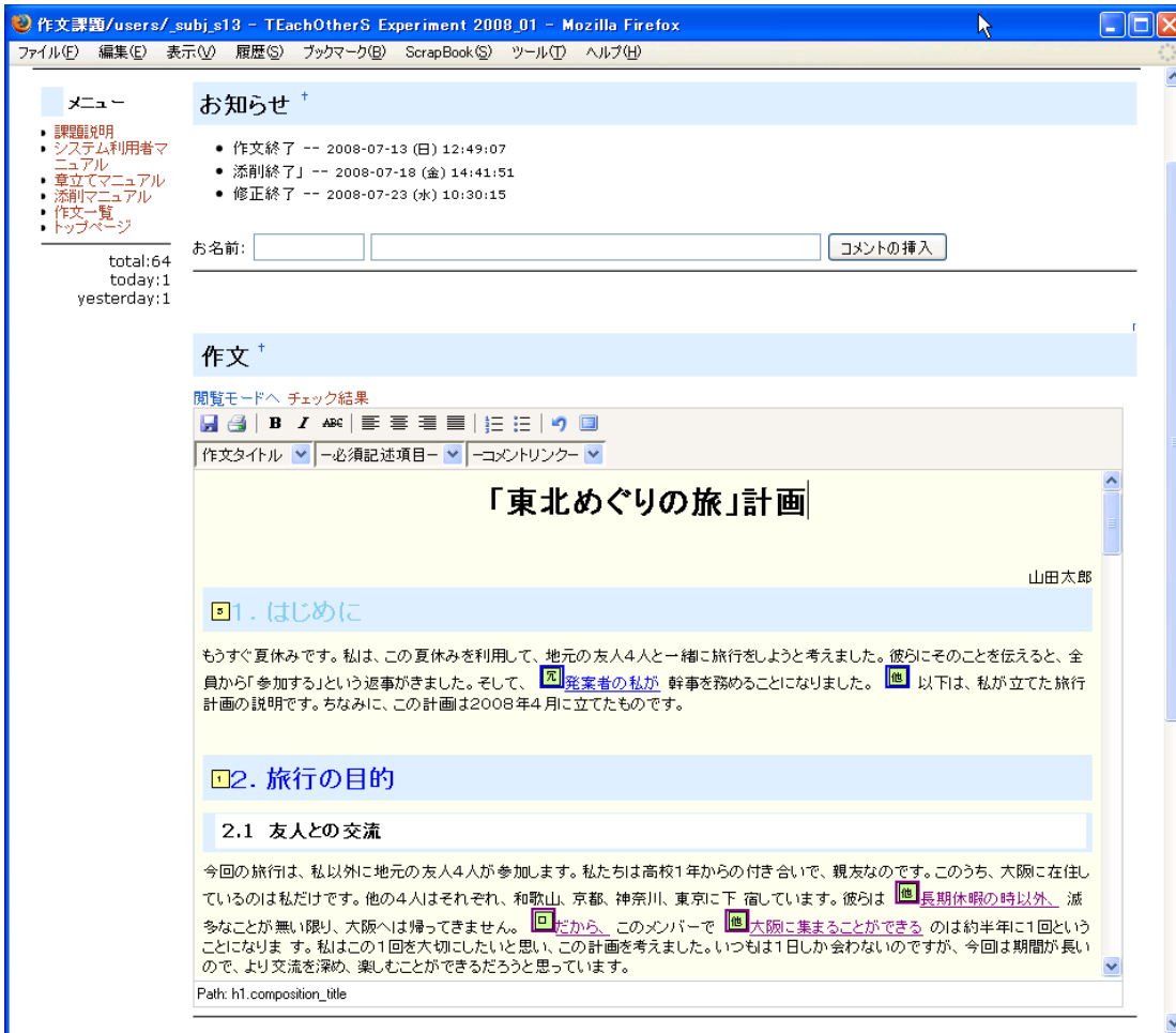
図 2 編集プラグインの実行例

Wiki を利用している理由の一つは、Web コンテンツを作成するのが容易なことである。Wiki は、HTML のタグではなく、Wiki の簡易的なタグで Web ページを作成できる。作文教育の担当教師は、必ずしも Web システムの利用や Web コンテンツの作成に精通しているとは限らない。しかし、もし、作文支援システムを含めた Web コンテンツを容易に作成できれば、授業の資料を含めた形の作文用の Web サイトを構築するという形で、作文支援システムを授業の中に導入しやすくするなると考えられる。